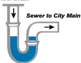
Working Floor Drain: Sewer Gases are Contained

Insituform is sending this handout to provide advance notice before beginning actual work.